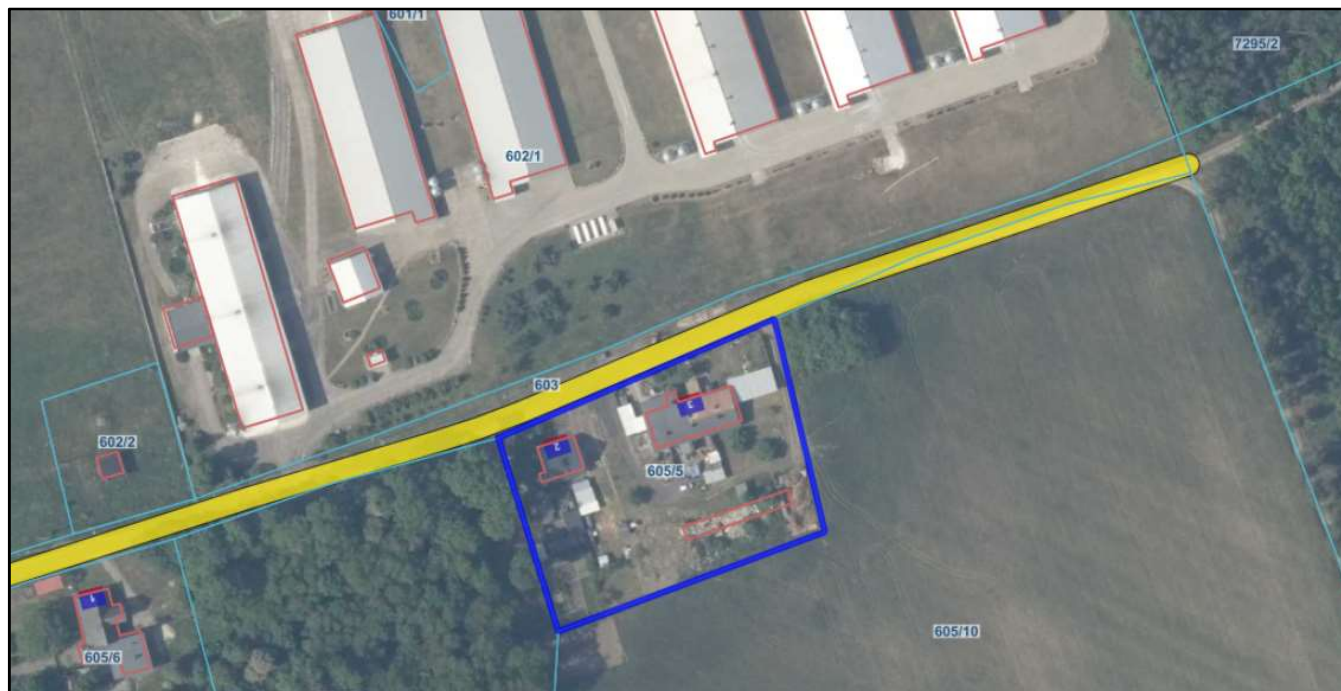
Mapa poglądowa

Cena wywoławcza nieruchomości została obniżona o ok. 20% w stosunku do ceny z I przetargu.